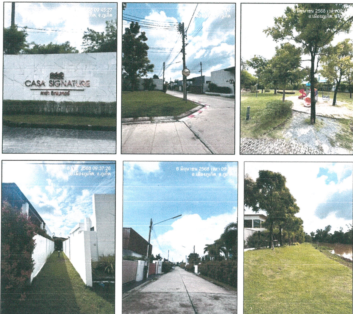
รูปภาพที่ 1.3 การใช้พื้นที่โครงการ